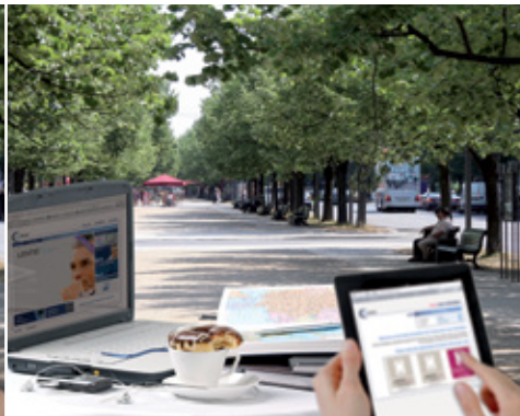
Komfort: LENTIS® Comfort