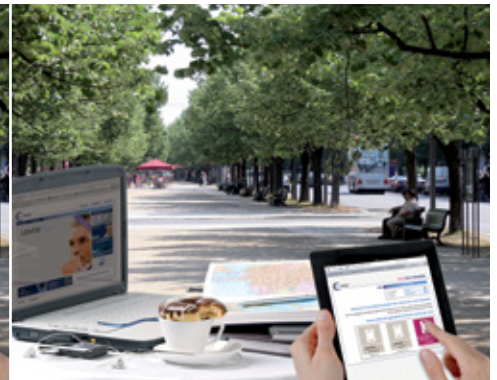
Premium: LENTIS® Mplus

Das spezielle Design der LENTIS® Comfort ermöglicht eine Kataraktbehandlung, die der Standard-Lösung weit überlegen ist. Durch das bewährte und von Oculentis patentierte Design ist die Linse optimal auf den Intermediärbereich abgestimmt und liefert hier sehr gute Ergebnisse. Dies ist insbesondere für anspruchsvolle Kataraktpatienten von Bedeutung, die sich mehr Brillenunabhängigkeit in Alltagssituationen, wie der Computerarbeit, beim Einkaufen oder beim Autofahren, wünschen.